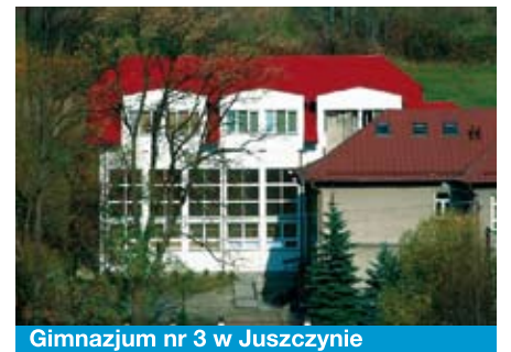
Gimnazjum nr 3 w Juszczynie

Los primeros intercambios informativos entre los centros tuvieron como resultado